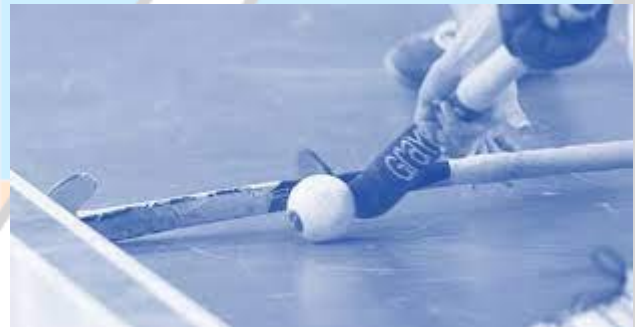
▲ Balk dicht gezet? Dan er omheen!

De speler met de bal zal dan een andere weg moeten kiezen, want de weg langs de balk is reglementair afgesloten.