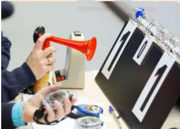
◀ De wedstrijdtafel houdt de tijd, de kaarten en de scores bij

LET OP! Het is van groot belang dat iedere wedstrijd exact op tijd begint. Hier mogen geen concessies aan gedaan worden, zelfs niet als het om een kampioenswedstrijd gaat en in een eerdere blok is men wat uitgelopen; uitlopen kan dus ook niet getolereerd worden!