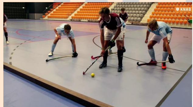
▲ Er moet ruimte zijn

LET OP! Verdedigers die een aanvaller in hun cirkel dreigen op te sluiten, riskeren een strafcorner als ze geen opening laten.