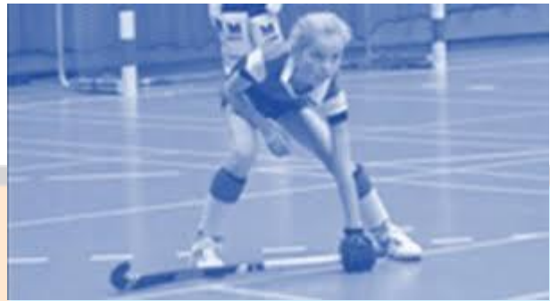
▲ Blok? Stick plat en hand op de grond!

Er is pas sprake van een blok als de stick plat op de grond ligt en geen speelruimte meer laat. De linkerhand ligt dan op de grond en de stick ligt stil. Dat moet het geval zijn vóórdat de bal wordt gespeeld . Als een verdediger de stick pas op de grond legt nadat er is gespeeld of de stick naar de bal toe moet bewegen, is het geen overtreding.